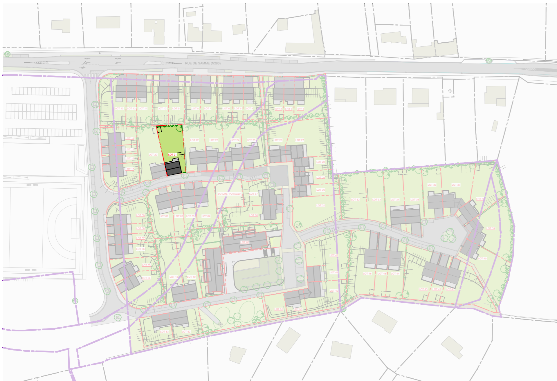
PLAN DE LOTISSEMENT